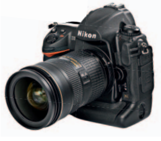
Nikon D3S und Nikon D3X